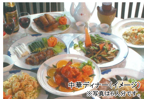
中華ディナー(イメージ) ※写真は6人分です。