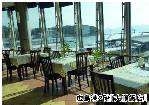
広島港2階『大鵬飯店』