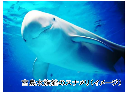
宮島水族館のスマメリ(イメージ)