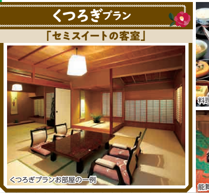
くつろぎプランお部屋の一例

道後温泉本館まで徒歩1分、飛鳥乃湯泉まで徒歩3分の好立地。慶応4年創業。繊細な日本の美意識が漂う数寄屋造りです。