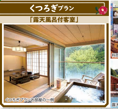
くつろぎプランお部屋の一例

西日本最大級の露天風呂「翠明の湯」はpH9.4のアルカリ性で美人の湯といわれており四季折々の自然を満喫いただけます。